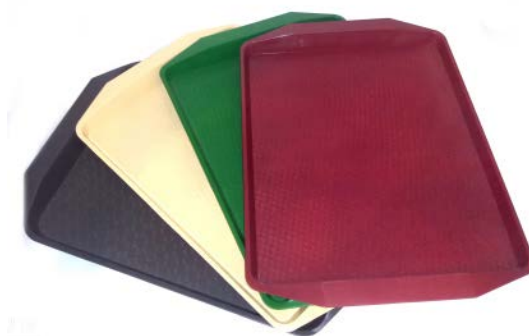
Поднос 1732-106 42x30 см, бежевый