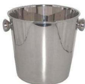
Ведро для шам- панского BS-III-D