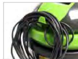
КРЮК ДЛЯ ШНУРА ЭЛЕКТРОПИТАНИЯ