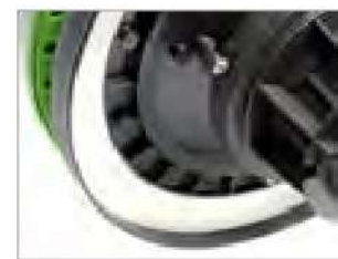
ИННОВАЦИОННОЕ УПЛОТНЕНИЕ ВСАСЫВАЮЩЕЙ ГОЛОВКИ