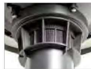
ВСТРОЕННАЯ ПРОТИВОПЕННАЯ СИСТЕМА