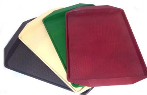
Поднос 1732-106 42x30 см, бежевый