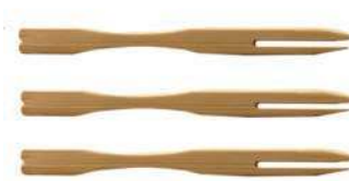
Вилочки для десерта BFP-9