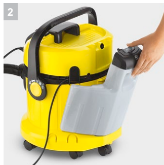
2 Съемный бак для чистой воды