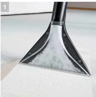
1 Система сопел Керхер

Мощный пылесос SE 4002, предназначенный для тщательной чистки текстильных и твердых напольных покрытий, работает по принципу распыления-экстракции и подходит как для сухой, так и для влажной уборки.