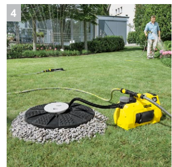
4 Оптимальное всасывание