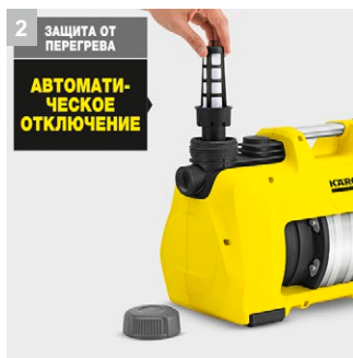
2 ЗАЩИТА ОТ ПЕРЕГРЕВА АВТОМАТИЧЕСКОЕ ОТКЛЮЧЕНИЕ