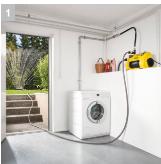
1 Простой в использовании дома и в саду.