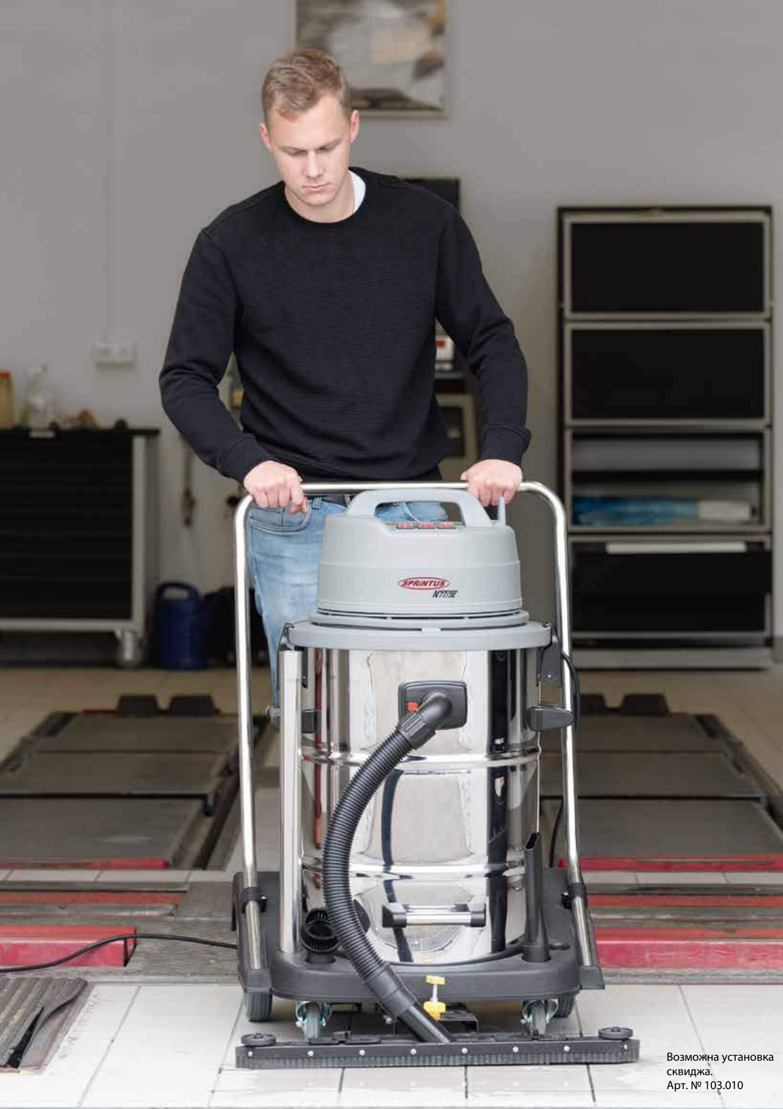
Возможна установка сквиджа. Арт. № 103.010