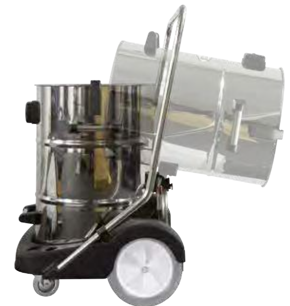
Удобная функция опрокидывания бака обеспечивает быстрое и легкое опустошение.

Высокопроизводительный пылесос для обслуживания промышленных объектов и индустрии общественного питания. Профессиональный пылесос, оснащен фильтром для мелкодисперсной пыли, текстильным мешком и дополнительными аксессуарами. Высокая производительность и легкость адаптации благодаря трем отдельно регулируемым турбинам. N77/3 E - невероятно надежный пылесос для влажной и сухой уборки, и предназначенный для интенсивного использования. Удобная функция опрокидывания позволяет опустошать бак легко и быстро. Прочное шасси с поворотными роликами и большими прорезиненными колесами обеспечивают бесперебойную работу, даже на деликатных поверхностях. Возможна установка сквиджа 650 мм.