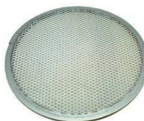
Сетка для пиццы AL-I D 11 28 см, алюминий