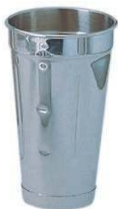
Стакан BS-V-H 0,9 л, нерж.сталь