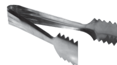
Щипцы для льда ST-E 16 см, нерж.сталь