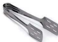
Щипцы для тортов CS-T ECO 20 см, нерж.сталь