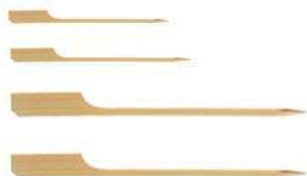
Пика для канапе «Гольф» BFS-9 бамбуковая, 9 см, упаковка 200 шт.