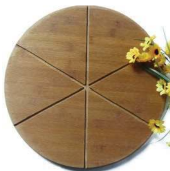
Разделочная доска для пиццы GASTRORAG / PB-330 диаметр 330 мм, толщина 12 мм, дерево