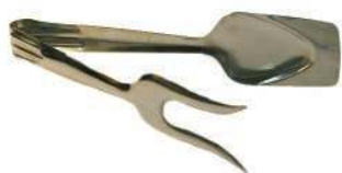
Щипцы для мяса RT-ECO 21 см, нерж.сталь