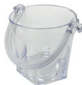
Ведро для шам- панского JW-1003 диаметр 125 мм, высота 130 мм, поликарбонат