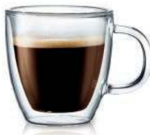
Кружка GASTRORAG / DG05 с двойными стенками, емкость 350 мл, стекло