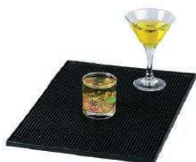
Коврик барный SBM широкий, 450x310x10 мм, цвет черный