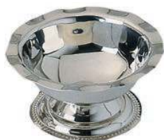
Креманка DS-I-F 150 мл, высокая, нерж.сталь