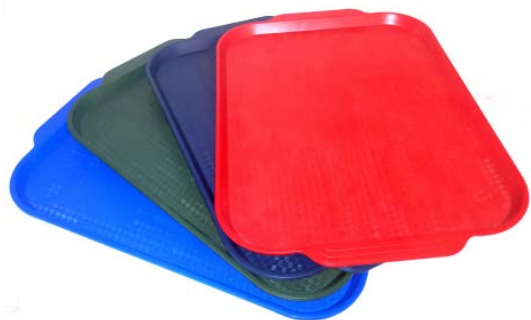
Поднос 1730-106 45x35,5 см, бежевый