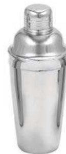
Шейкер BS-I-I 0,5 л, нерж.сталь Шейкер BS-I-H 0,7 л, нерж.сталь