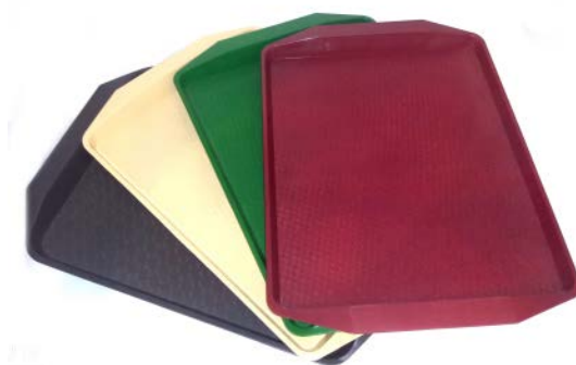
Поднос 1732-106 42x30 см, бежевый