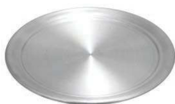
Противень для пиццы AL-I F A 11 28 см, алюминий