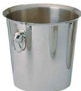
Ведро для шам- панского BS-IV-D 4,5 л, нерж.сталь