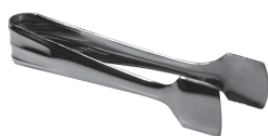
Щипцы для сахара ST-SE 11 см, нерж.сталь