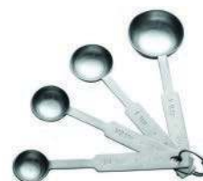
Ложка мерная KW-I X 4 шт., нерж.сталь