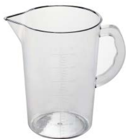
Мерный стакан GASTRORAG / JW-607C 0,5 л, поликарбонат