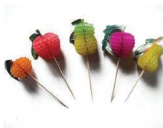
Пика «Фрукты» FS-10 декоративная, 10 см, упаковка 100 шт.