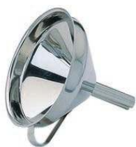
Воронка KW-III-K с ручкой, диаметр 14 см, нерж.сталь