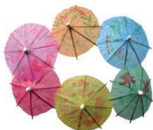
Пика «Зонтик» US-10 декоративная, 10 см, упаковка 144 шт.