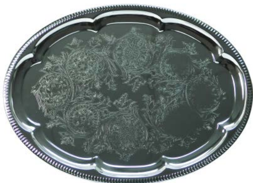
Поднос GASTRORAG / FT-1 овальный, 45,5х34 см, толщина 0,35 мм, хромир.сталь