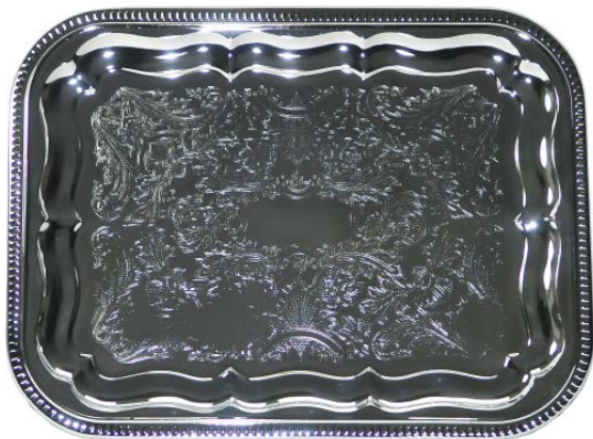
Поднос GASTRORAG / FT-3 прямоугольный, 41,1х31 см, толщина 0,35 мм, хромир.сталь