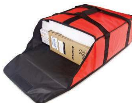
Сумка для пиццы GASTRORAG / PBG 3035 средняя, вместимость 4 пиццы диаметром 30 см или 3 пиццы диаметром 35 см, нейлон, цвет красный 457x438x196 мм