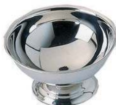
Креманка DS-I-J европейская, нерж.сталь