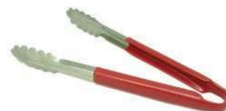
Щипцы CP-I A 12 R 0.7 30 см, нерж.сталь, ручки из пластмассы