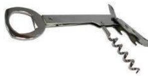
Нарзанник GHIDINI/25 4-х функциональный