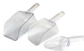
Совок кухонный P-039 946 мл, поликарбонат, 280x120x116 мм