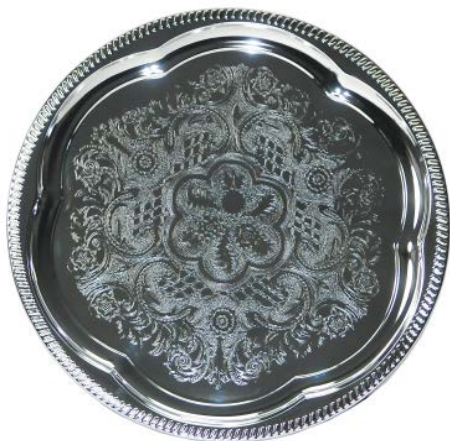
Поднос GASTRORAG / FT-2 круглый, диаметр 35,3 см, толщина 0,35 мм, хромир.сталь