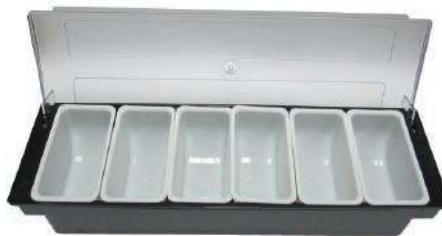
Контейнер для бара СН-6 6 лотков, с крышкой, пластмасса, 490x160x97 мм