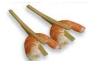
Щипчики для морепродуктов BT-9 бамбуковые, 9 см, упаковка 100 шт.