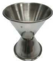
Дозатор для коктейлей J-1x2 джиггер, нерж.сталь, 30 мл/60 мл