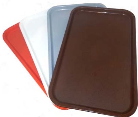
Поднос 1737-106 53x33 см, бежевый