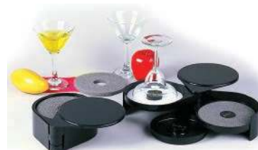
Риммер RM-3 Тройной, пластмасса 200x160x70 мм