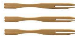
Вилочки для десерта BFP-9 бамбуковые, 9 см, упаковка 100 шт.