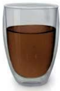
Стакан GASTRORAG / DG03 с двойными стенками, емкость 450 мл, стекло