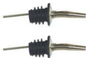
Комплект гейзеров BS-II-G к разливным устройством, хромированные, 2 шт.