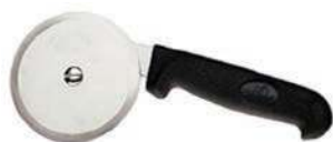
Нож для пиццы AL-II F 4 круглый, диаметр 10 см, с пластмассовой ручкой