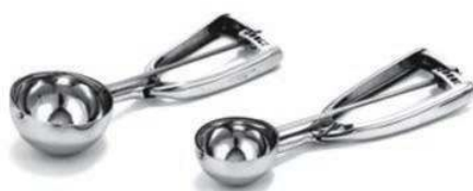
Ложка для мороженого ICD-25 емкость 25 мл, диаметр 4,5 см, нерж.сталь