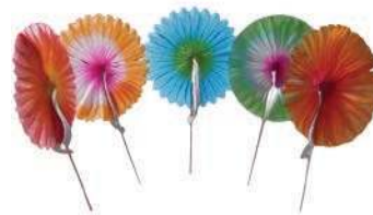
Пика «Цветок» SS-7 декоративная, 7 см, упаковка 100 шт.