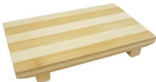
Поднос для суши GASTRORAG / SS070-S 21x12x3 см, бамбук