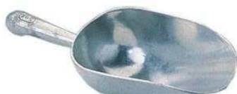
Совок KW-III-M12 340 г, алюминий