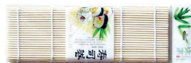
Коврик для суши GASTRORAG / SM011 24x24 см, бамбук