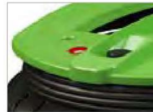
ИНДИКАТОР НАПОЛНЯЕМОСТИ ПЫЛЕСБОРНИКА